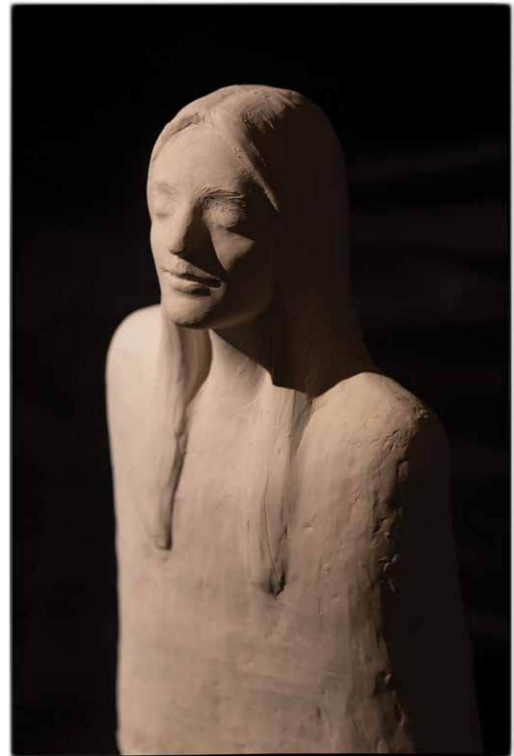
Jagababa , 2020 žgana glina