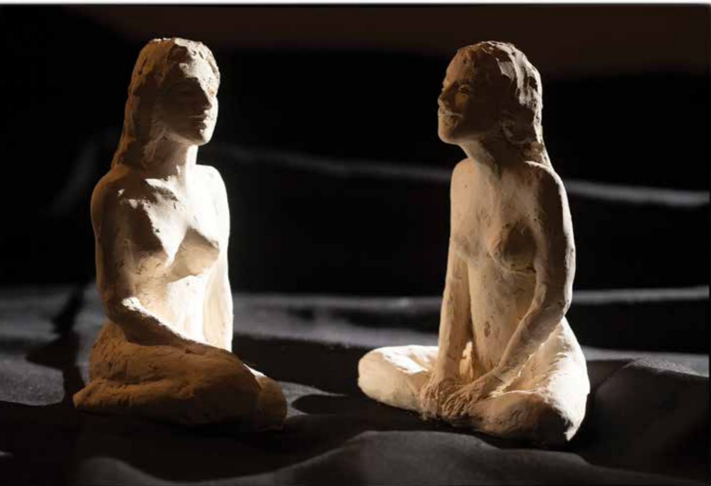
Pogovor , 2020 žgana glina