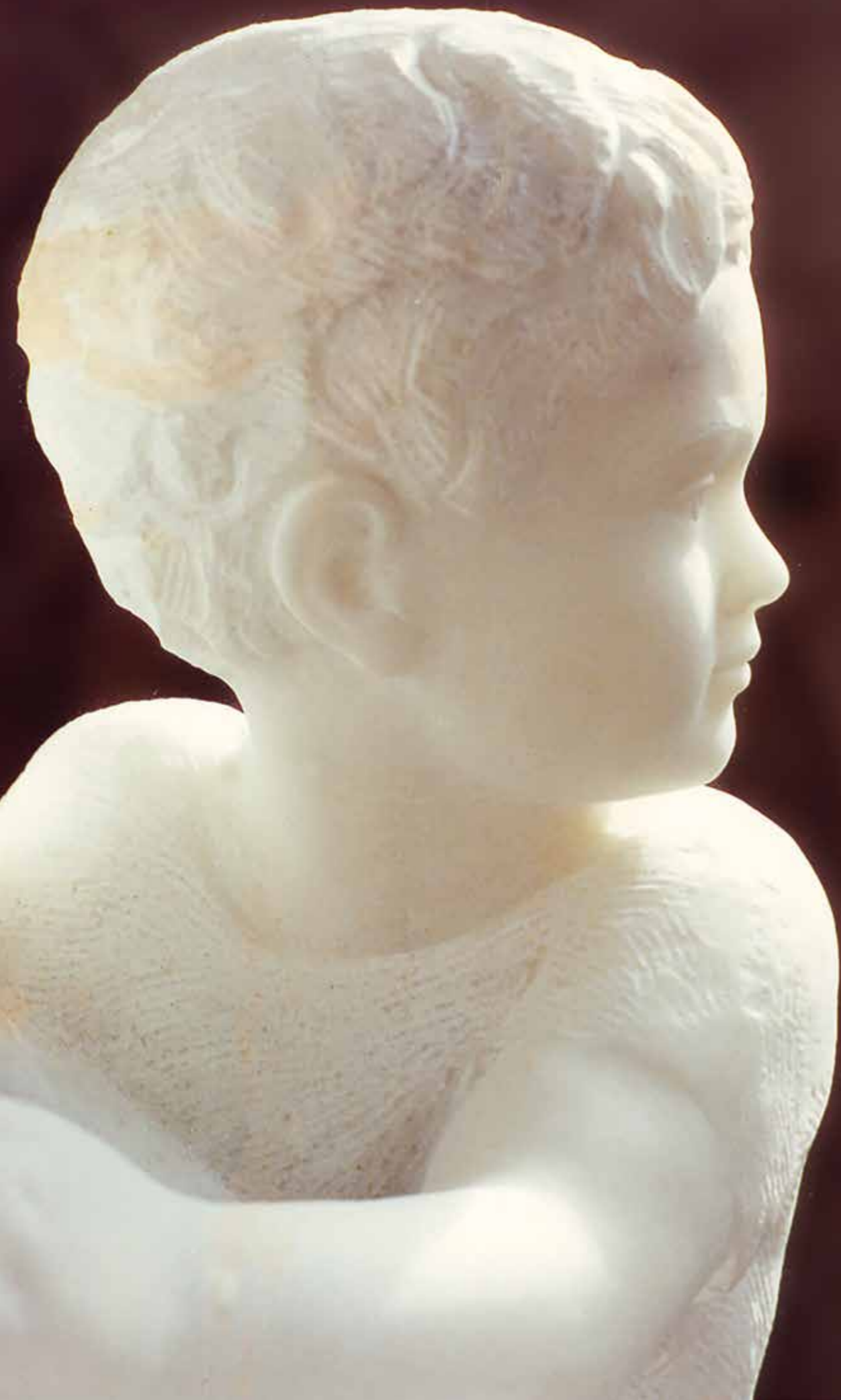
Up, 1991 kamen