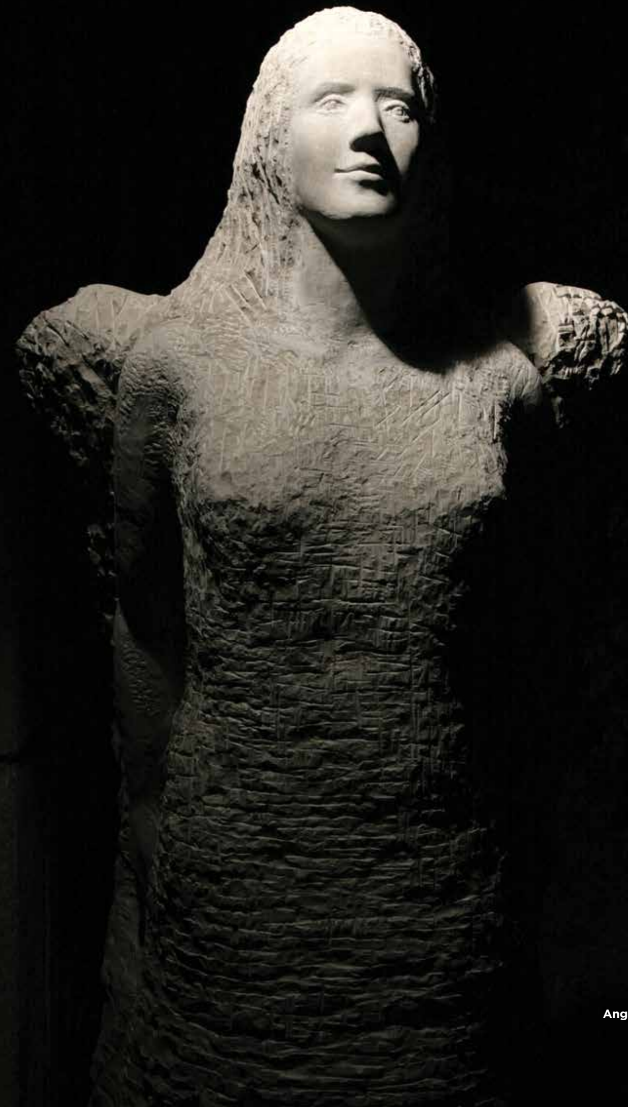
Angel, 2008 kamen