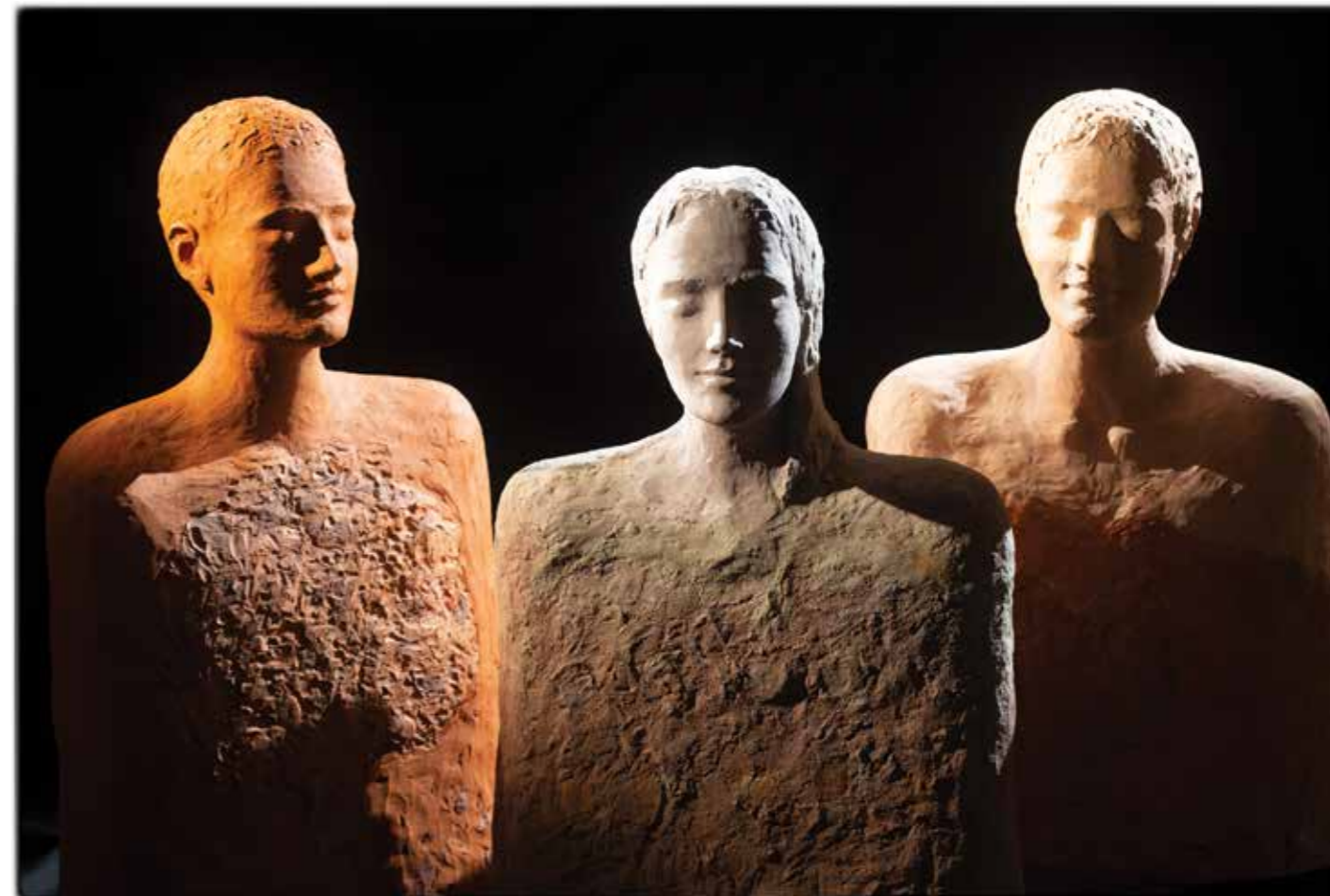
Trio , 2019/2020 žgana glina