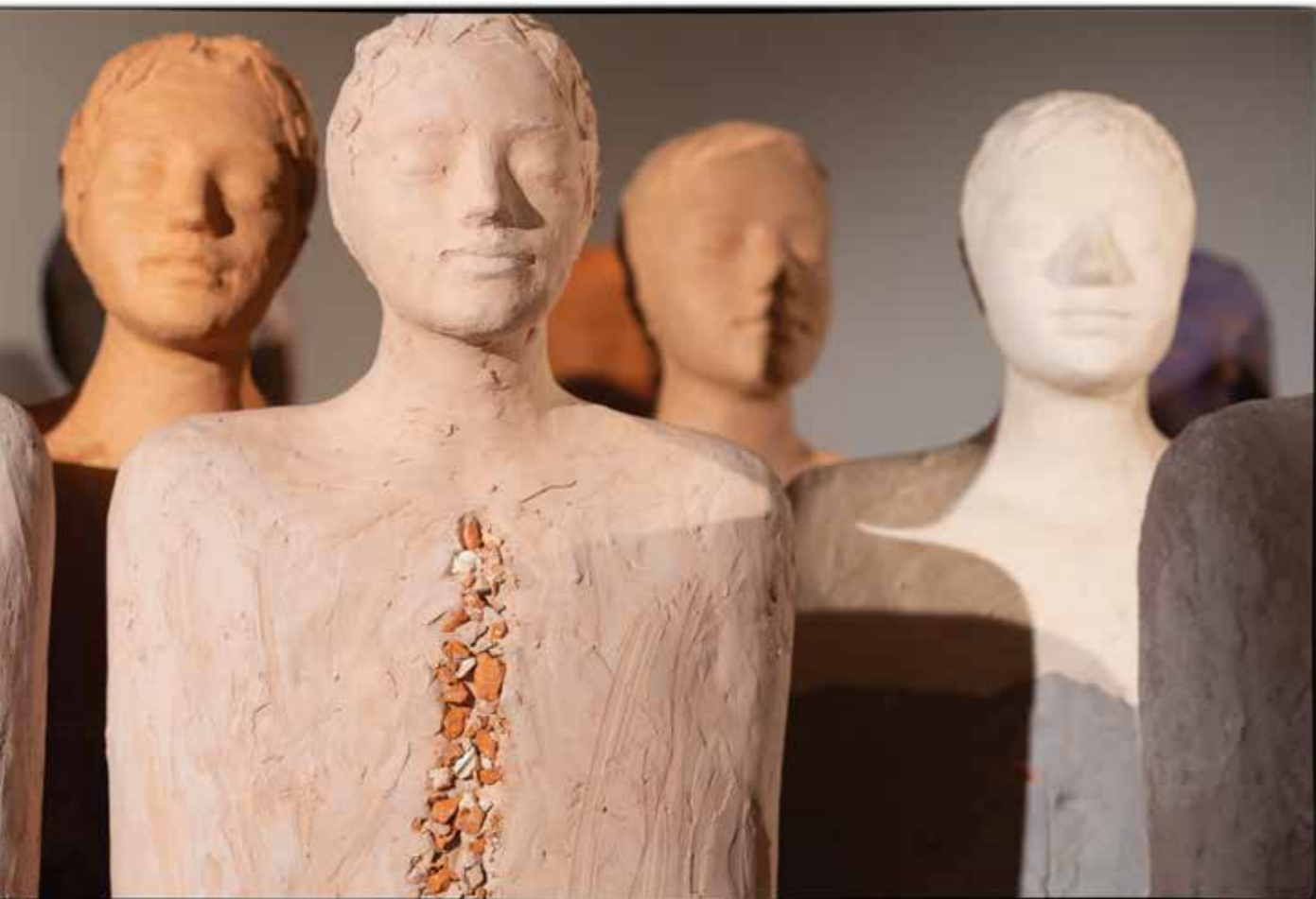
Zmagovalci , 2019/2020 žgana glina