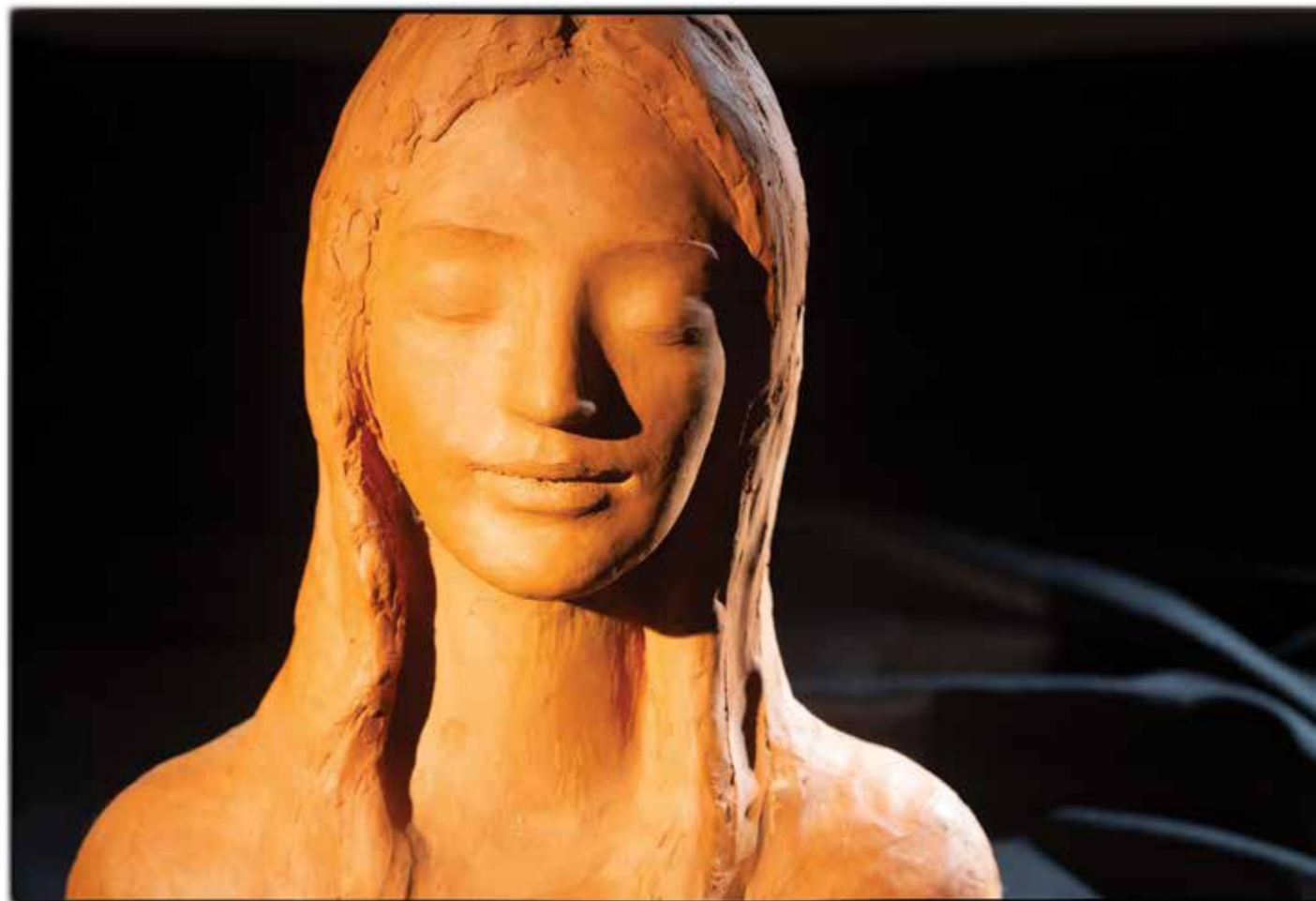
Moč , 2019 žgana glina